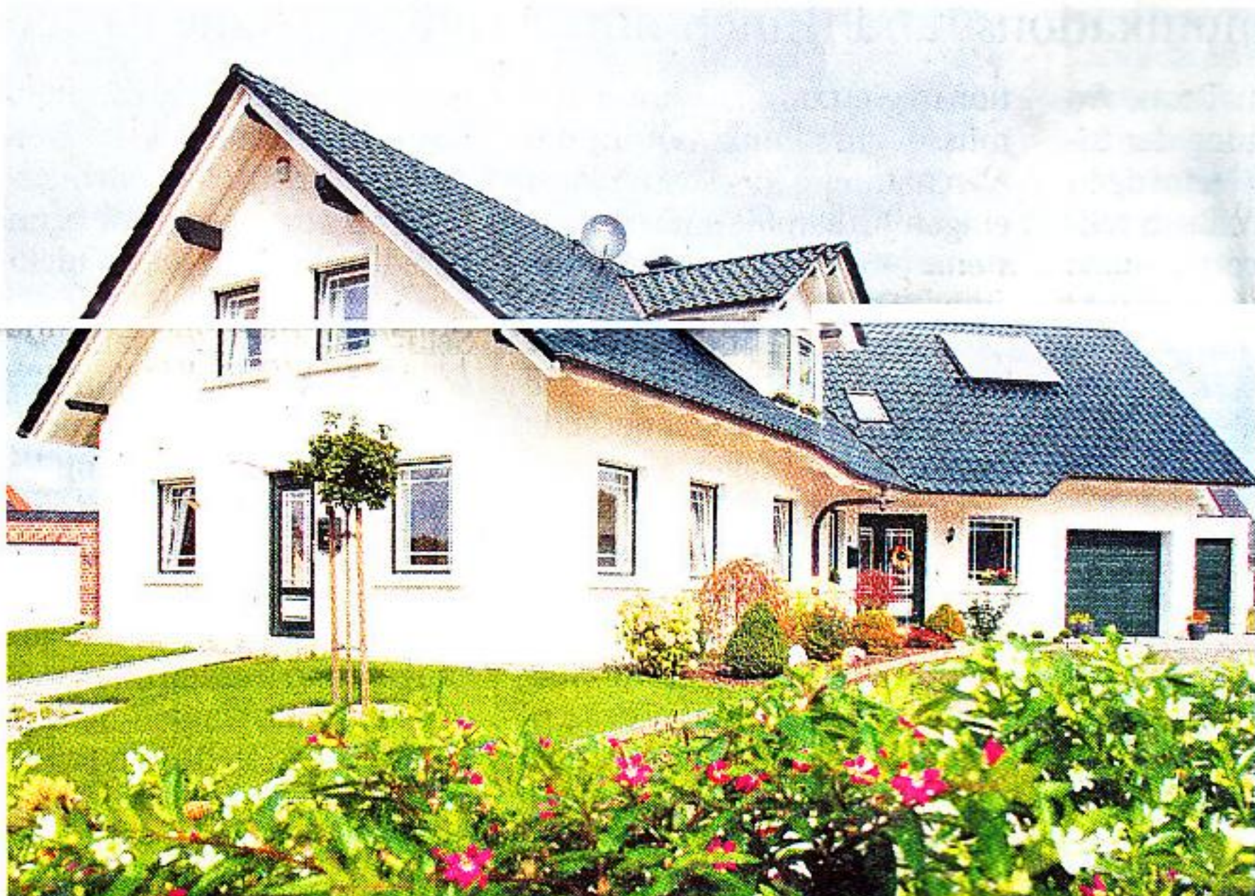
Steuertrick Einliegerwohnung: Die Wohnung wird privat genutzt. Beim Finanzamt ist sie als vermietet angegeben, um den Ausgleich für Belastungen zu kassieren.