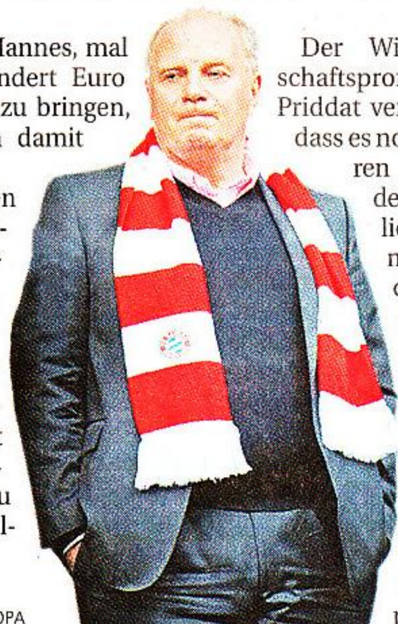
Kein Vorbild mehr: Steuersünder Uli Hoeneß.

ten kleinen Mannes, mal ein-, zweihundert Euro auf die Seite zu bringen, hängen auch damit zusammen, dass die Eliten ihre Vorbildwirkung verloren haben. Das Bild vom Neureichen, der sich auf dem Golfplatz damit brüstet, wenig Steuern zu zahlen, ist allgegenwärtig.