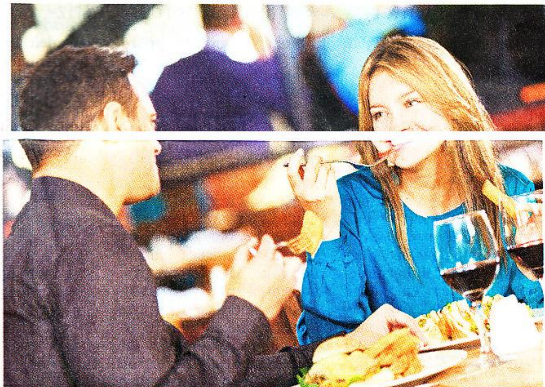
Steuertrick Geschäftsessen: Es wird privat gespeist, aber die Rechnung für fingierte „Geschäftskunden“ geht mit der Steuererklärung zum Finanzamt.