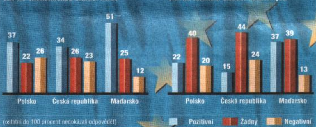
Vliv na finanční situaci dotázaných